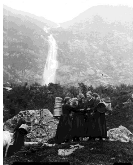
Brufoss.

Den legendariske turisthistoria frå andre halvdel av 1800-talet og fram til første verdskrigen grunna seg på Bondhusdalen, ridevegen med alle svingane opp til Gardshammar, Bondhusbreen, Bondhusvatnet, ridevegen frå Austrepollen og like fin veg ned på andre sida av Folgefonna til Odda. Saman med fossefalla Brufoss og Sundefossen, Sunndal pensjonat og hestetransport over Folgefonna og Mauranger i seg sjølv er dette landskjent historie. Kunstnarar som Amaldus Nielsen og Anders Askvold kom óg og fann motiv her. Etter at Fonnabu vart bygd, har Bondhusdalen vore sentral i friluftslivet på Folgefonna.