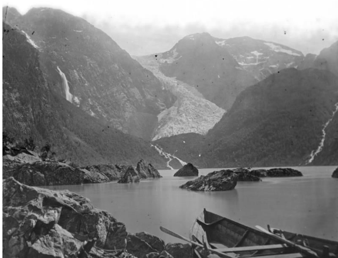
Bondhusdalen, Brufoss til venstre.

frå Fønderdalen og frå Bondhusbreen. Og Brufossen, ført opp som den tiande høgaste fossen i landet på internett. Brufossen stod markert i landskapet rett ved Bondhusbreen.