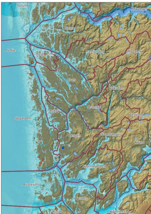
Figur 2. Registreringer av kysthumle for perioden 2000-2023. Funnet på den største myra i Kokstaddalen (blått) er eneste funn i Bergen kommune i perioden. Det er gjort 8 funn i de tilgrensende kommunene, med nærmeste funn ca. 15 km unna.