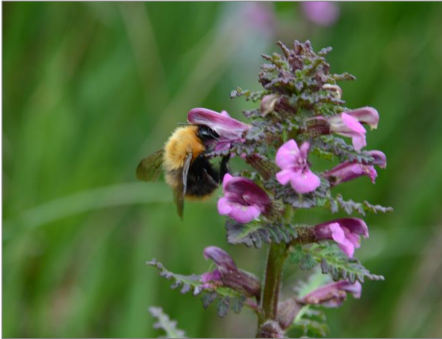
Figur 1. Kysthumle på myrklegg på den største myra i I/L2 i juni 2022. Arten ble for øvrig funnet igjen på samme myra i juni 2023. Dokumentasjon av arten er vurdert av forfatter av naturmangfoldrapporten (Opus), og arten er bekreftet (gjelder bildet fra 2023).