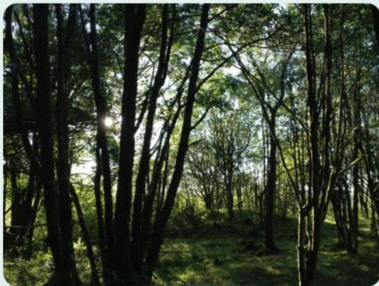
Løvskogen på Smøråsfjellet