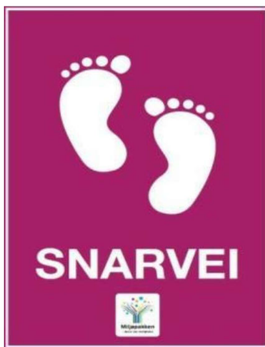
Snarvegskiltet i Trondheim