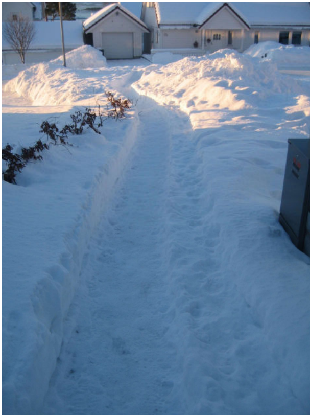
En nabo har snøfrest snarvegen - HURRA