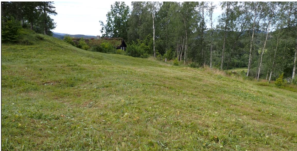
Figur 2. Teigen, mot nord.