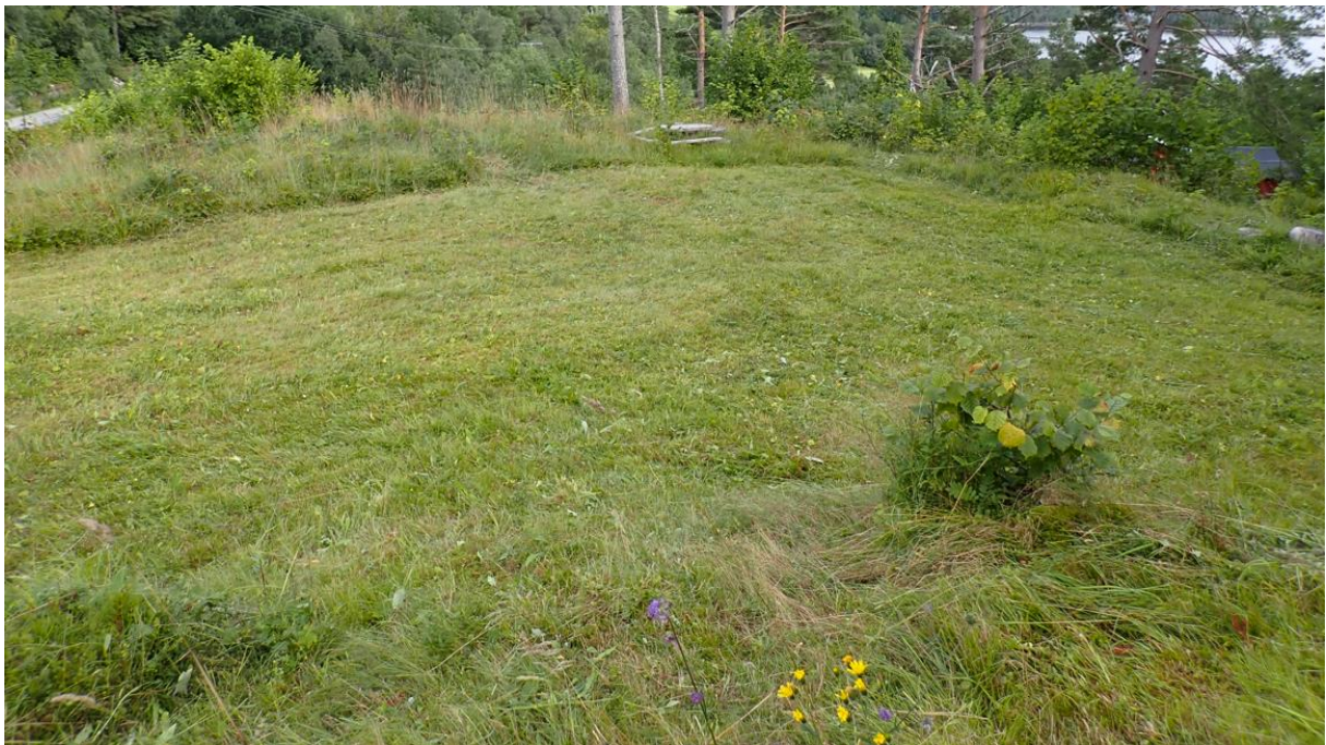
Figur 4. Mot søraust.