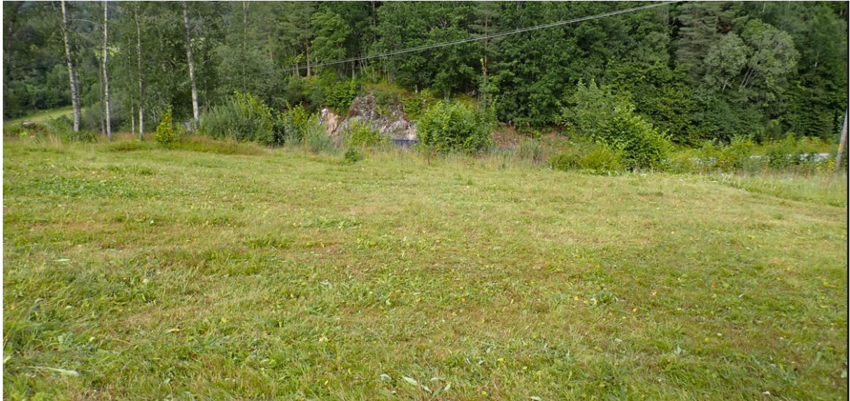
Figur 3. På nordaustsida av den øvre teigen.