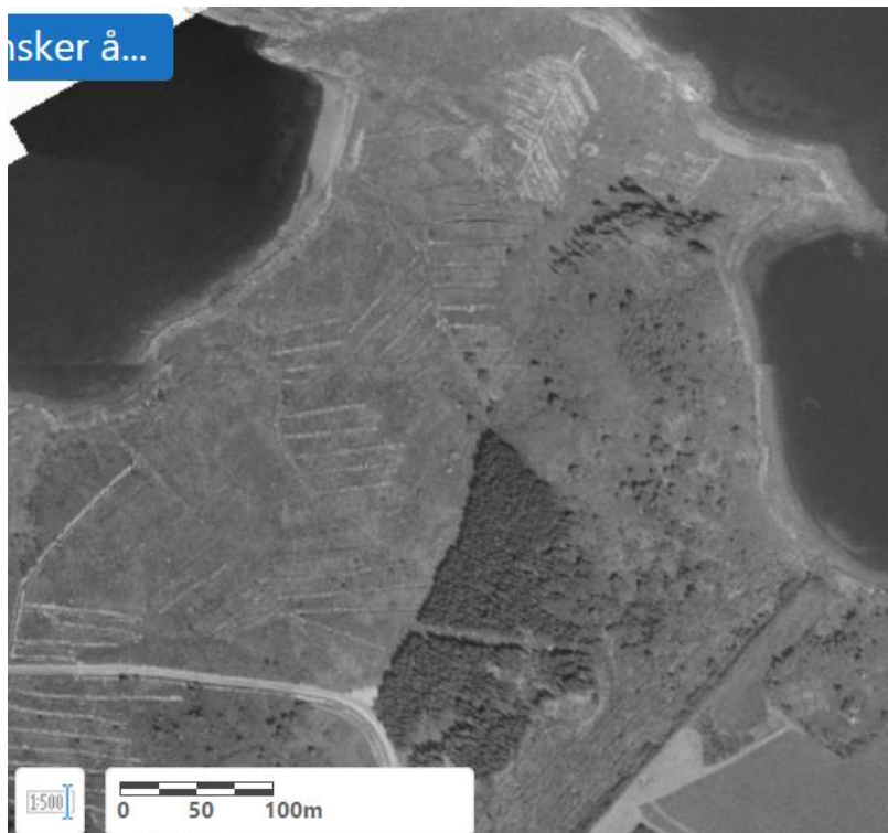
Gislink. 1972, der ein ser eit nytt og omfattande grøftesystem.

For å gjere dette på rett måte bør nokon frå kulturmynde, nokon frå friluftslivet, nokon med biologisk og ein dyrehaldar setje seg saman for å finne ei løysing for nær og fjernare framtid for Ikornneset. Sitt ein igjen med ein handlingsplan som tar omsyn til alle fagfelte, så er det vel også gode utsikter til å få statlege pengar til ein del av dette.