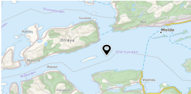
Figur 1: Oversiktsbilde

Søknaden er begrunnet med et behov for tilstrekkelig lokalitets-MTB (maksimal tillatt biomasse) i forhold til de tillatelsene selskapet har i område PO5. I tillegg begrunnes søknaden med et behov for erstatningslokalitet og vi gjengir følgende fra søknaden: