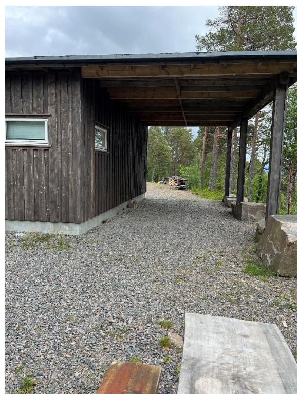
Ett av de eksisterende byggene ved Liavegen