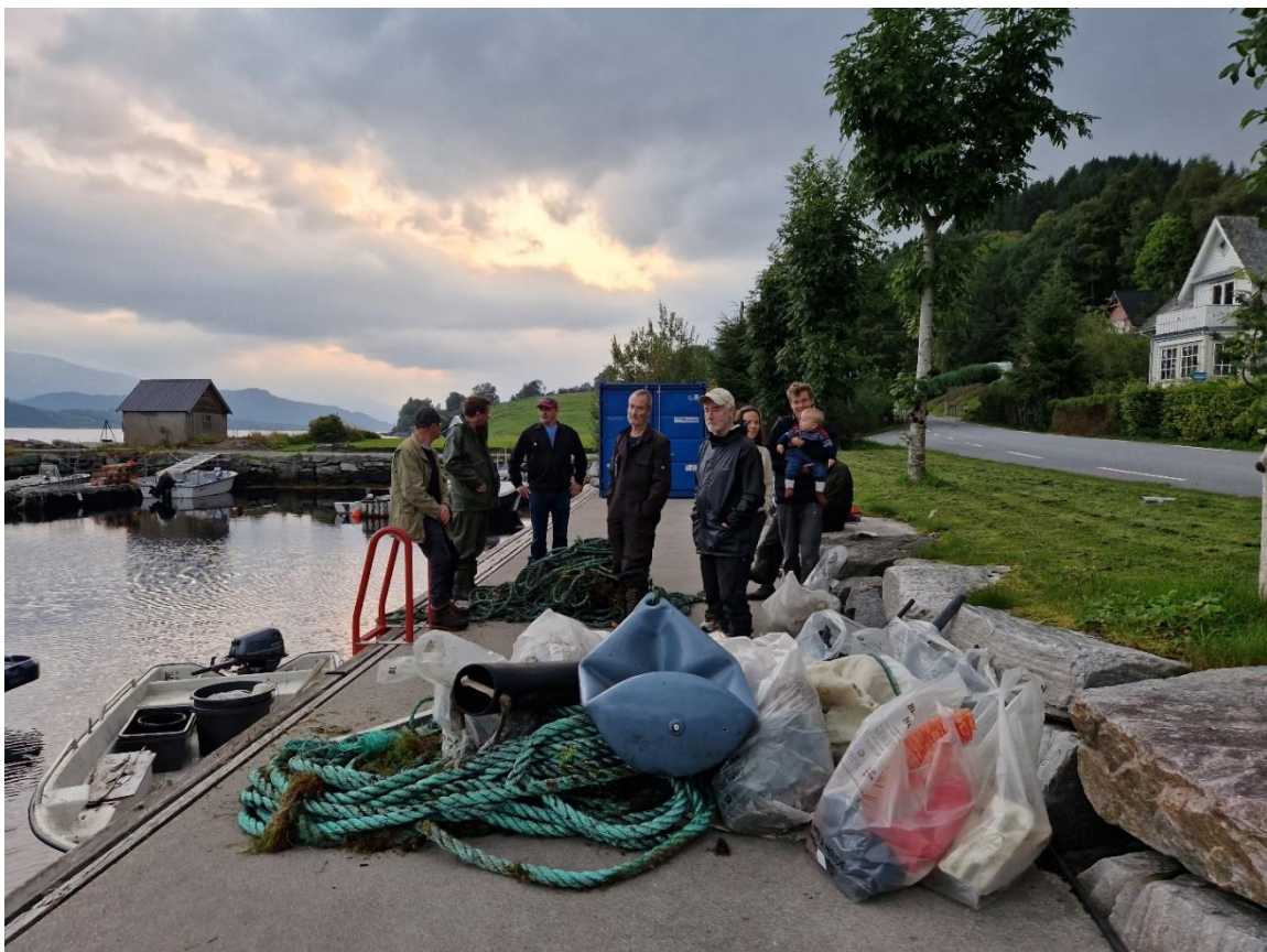
Figur 12 Endt ryddeøkt i Vevring 7. september. Mye tauverk og annet marin forsøpling ble plukket.

Strandryddeuka har engasjert frivillige og privatpersoner, samt grendalag og ungdomsklubber. Årets erfaring og fangst har vært til inspirasjon og øyeåpner. Flere har uttrykt en liknende rydding til våren.