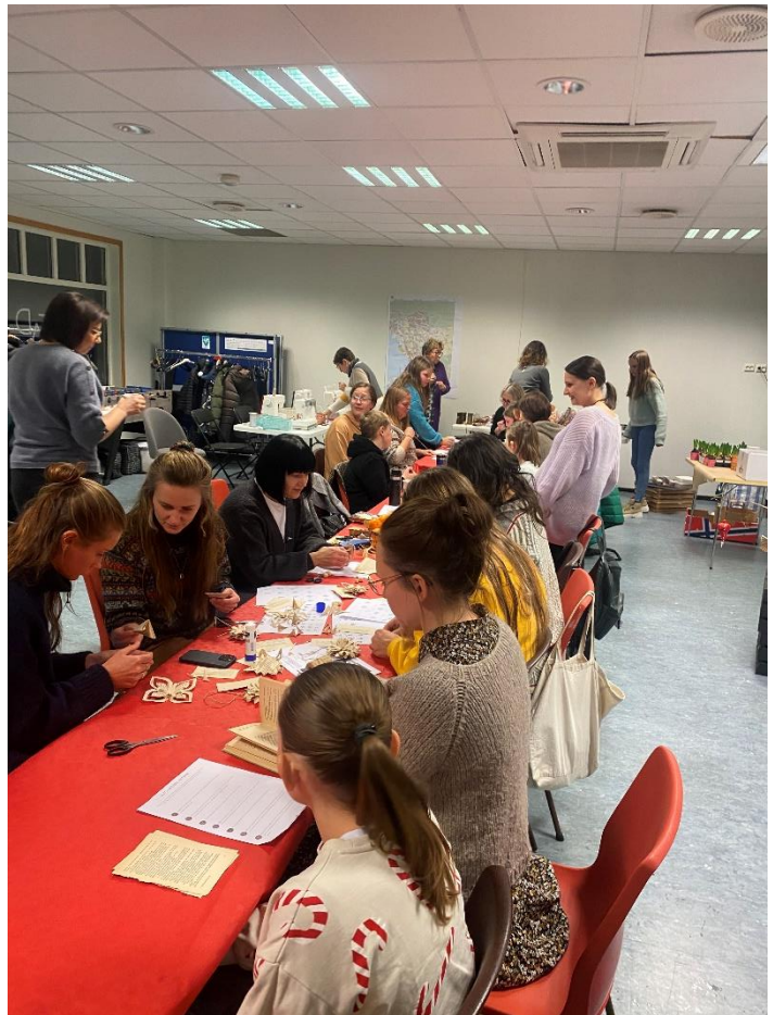
Figur 7 Juleverksted på Eid var populært med mange deltakere. Til og med lokalavisa var innom for å dekke begivenheten.

Det vart laga julepynt og julegåver med utgangspunkt i gamle bøker, tapetprøver, treperler, gamle hekla dukar, gamle putevar, tekstilrestar, restegarn, stearinlysstumper, svibler, garn og tråd. Nokre bretta papirstjerner, englar og juletre. Andre hekla hjerter og snøkrystallar. Nokre laga flotte dekorasjonar med treperler og andre sydde seg flotte gaveposer og julekuler. Deltakerne var særst nøgde med arrangementet.