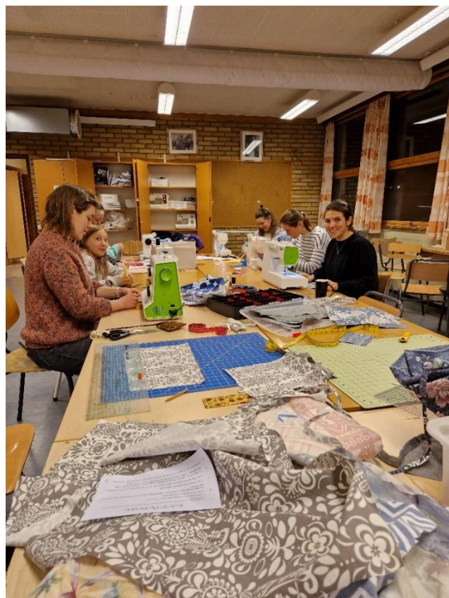
Figur 6 Flere hadde kommet til Sande skule for å lage tøypose som både kunne være julegave og julegaveinnpakning.