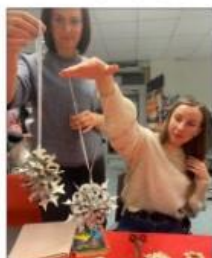
FLOTT RESULTAT: Det vart laga mykje flott julepynt under juleverkstaden.