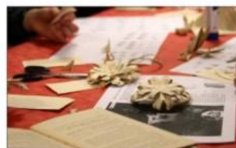
GAMMAL BOK: Eitt tips til andre er å bruke ei gammal bok til å lage julepynt med. Desse pyntane på bildet kan ein også bruke som rosett på julegåver.