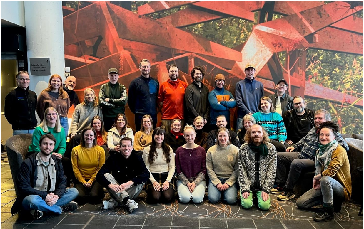
Figur 1 NFO samling på Kolbotn januar 2024.

presentert fremtidige prosjekter som kan være relevant for Naturvernforbundet Sogn og Fjordane å engasjere seg i.