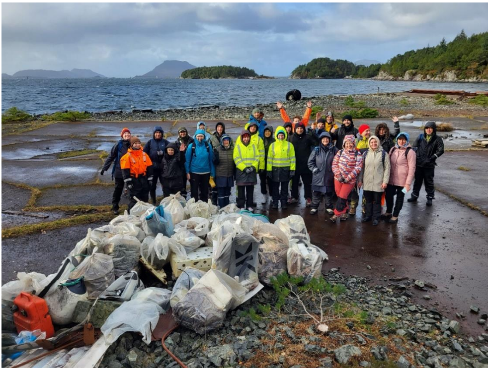
Figur 4 Endt rydding med Kurs KF og medlemmer i NNV, torsdag 12. oktober.