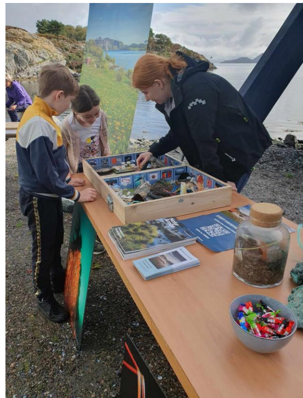
Figur 9 Engasjerte barn som ser i naturkassa Naturvernforbundet Sogn og Fjordane og Fjordane Friluftsråd eier.