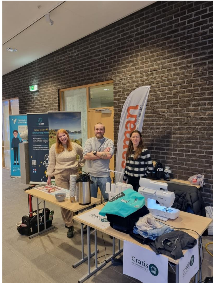
Figur 10 Saman, Naturvernforbundet Sogn og Fjordane og Me Syr på stand ved HVL Førde. Flere studenter hadde tatt med seg klær som trengte litt oppmerksomhet.

I forbindelse med Miljøveka Høgskulen i Vestlandet (HVL) arrangerte 2. november, hadde Saman, Naturvernforbundet og Me Syr stand i Førde. Her fikk studenter reparert slitte klær og sykler helt gratis. Det ble også servert vegetarmat i kantina i forbindelse med Miljøveka.