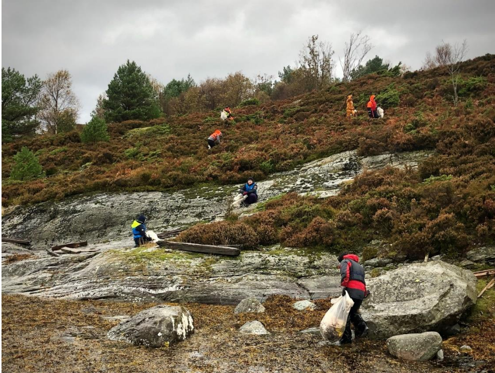
Figur 3 Rydding på Langholmen.