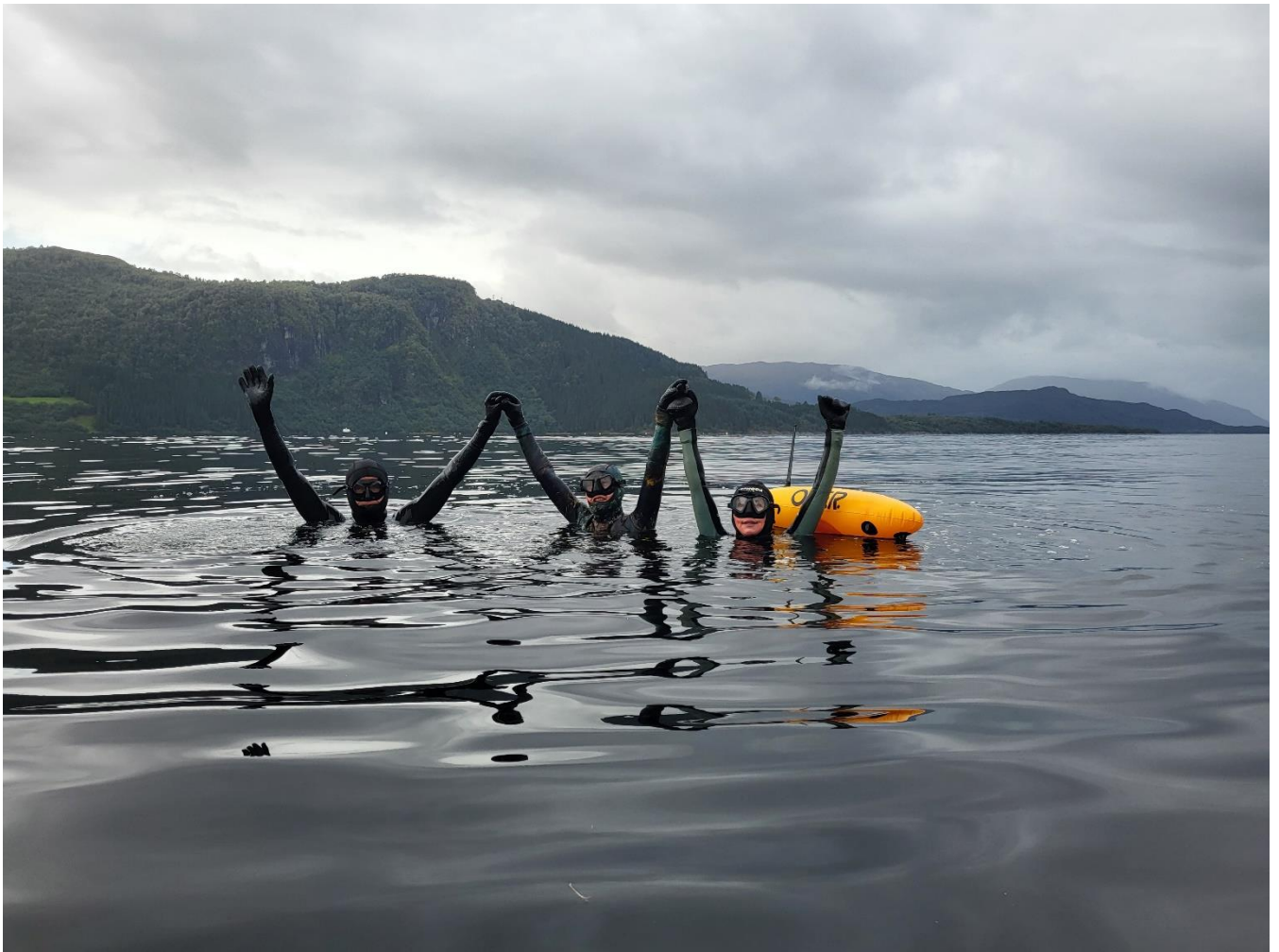
Figur 18 Tredje etappe gikk forbi Engebø og gruveområdene. Dette ble naturlig nok en emosjonell etappe. Etappen ble svømt i lag ned toksikolog Marte Haave og økolog Gaute Velle.