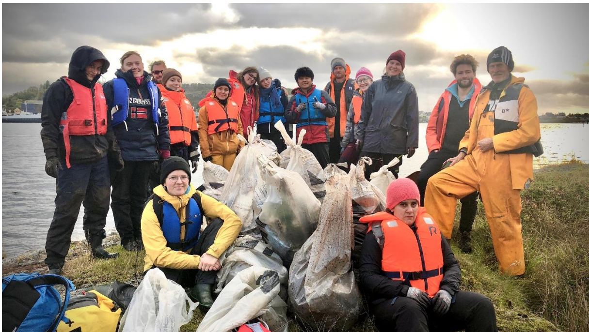
Figur 2 Ryddeøkt på Langholmen, torsdag 12. oktober. Her i lag med elever fra UXC, deltakere i NNV, og ansatte ved Fjordane Friluftsråd og NNV.

Det ble plukket til sammen 2093 kg søppel under ryddeseilasen. En formidabel innsats av deltakere.