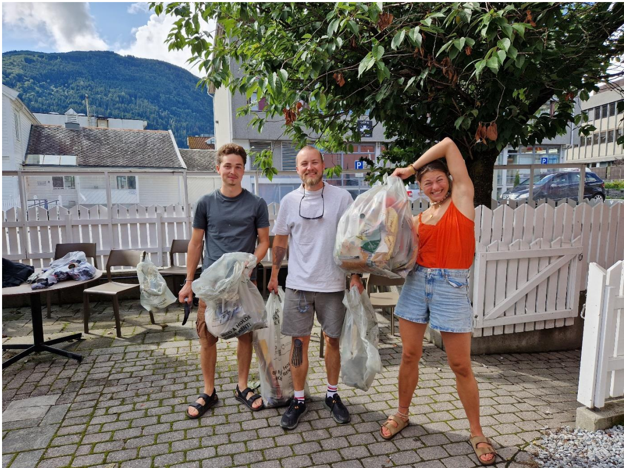
Figur 11 20 kg avfall ble plukket i Sogndal sentrums gater. Underveis ble det tid til litt vaffelpising utenfor Studentsamfunnet i Sogndal.

Grunnet lite kapasitet ved HVL campus Førde, ble det ikke arrangert studentenes ryddeaksjon i Førde.