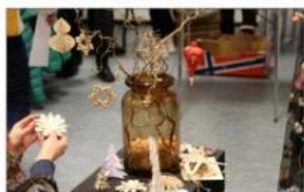
UTAN PLAST: Målet med kvelden var å lage julepynt utan plast.