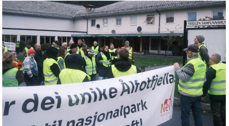
Utanfor Svelgen Samfunnshus har fleire innbyggjarar samla seg for å demonstrere mot vindkraftutbygginga på Ålfotfjellet. Dei har på seg gule vester som eit teikn på protest mot vindkraft.