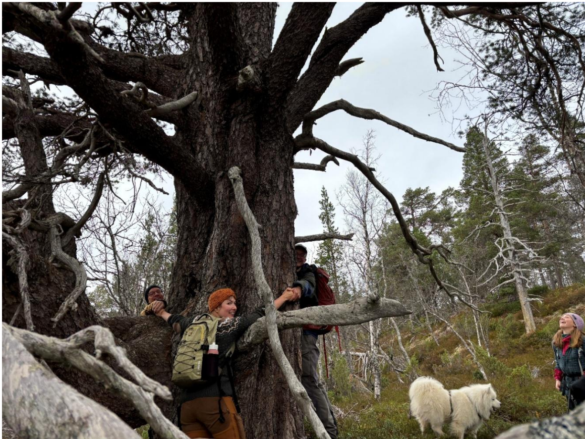
Frå furuskogvandring i Sogndal, der furua på bildet var så stor at det måtte 3 stykk til for å famne om heile treet!

Gjennom eit samarbeid med prosjektet Naturglede frå Naturvernforbundet vart det også invitert til ein furuskogvandring i Sogndal. Her fekk vi med oss ein ekspert frå Høgskulen på Vestlandet som lærte oss om mosar på vegen til ein naturskogen med store furutre. Det vart ein kjekk tur med mykje kunnskap og rike naturopplevingar.