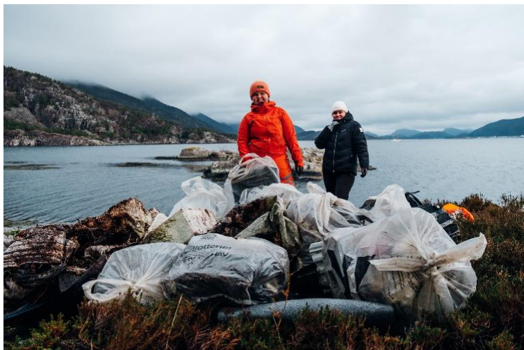
Strandrydding i Botnafjorden.