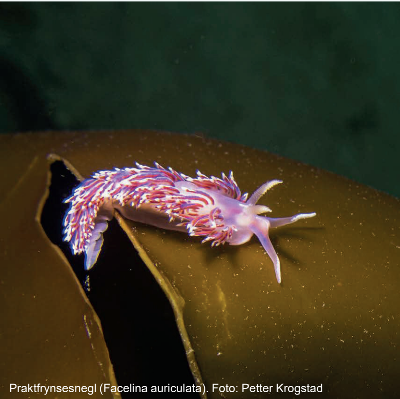
Praktfrynsesnegl ( Facelina auriculata ).