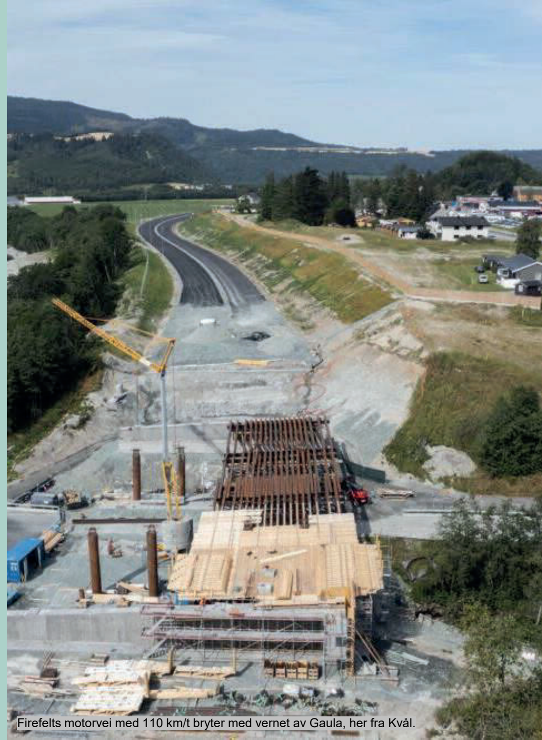
Firefelts motorvei med 110 km/t bryter med vernet av Gaula, her fra Kvål.

Naturvernforbundet mener vi først må ta vare på de veiene vi har, før vi bygger ut arealkrevende motorveier. Det må også satses på kollektivtrafikk, buss og tog.