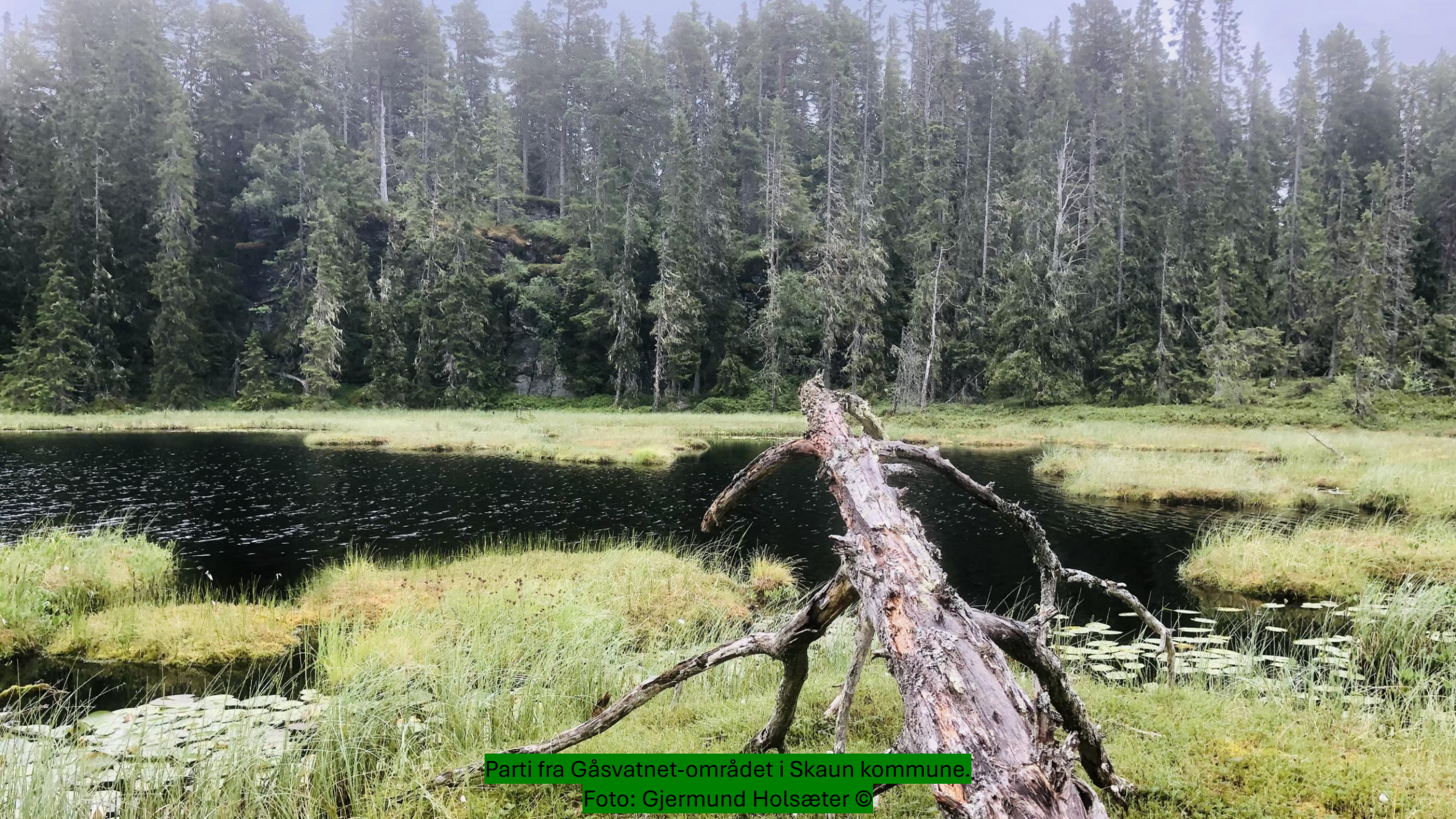
Parti fra Gåsvatnet-området i Skaun kommune.