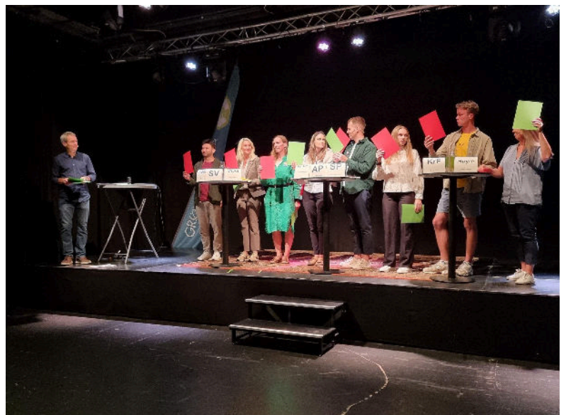
Den Store Klima- og miljødebatten