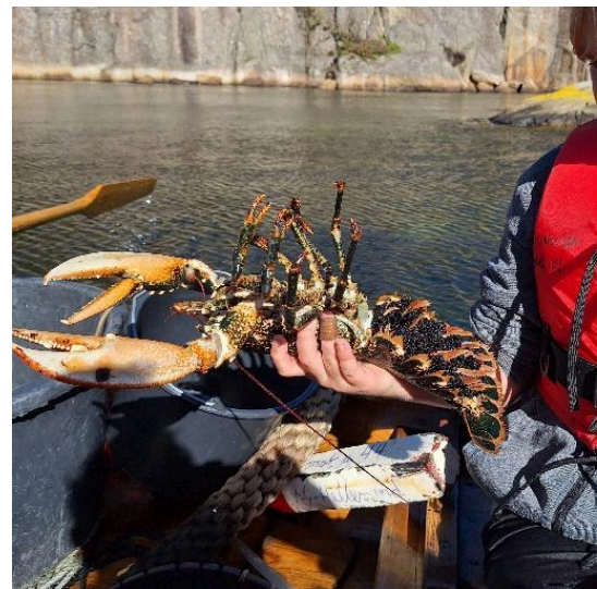
21. sept. 2025: Familiearrangement i Romsvika om sjømiljø, akvarium og kjøring av ROV m/visning på storskjerm