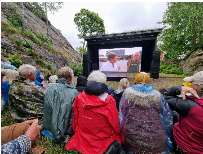
Filmvisning: Vår felles natur – Vakker og sårbar