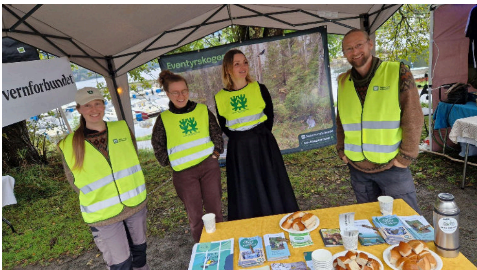
Stand på Feda elvelangs