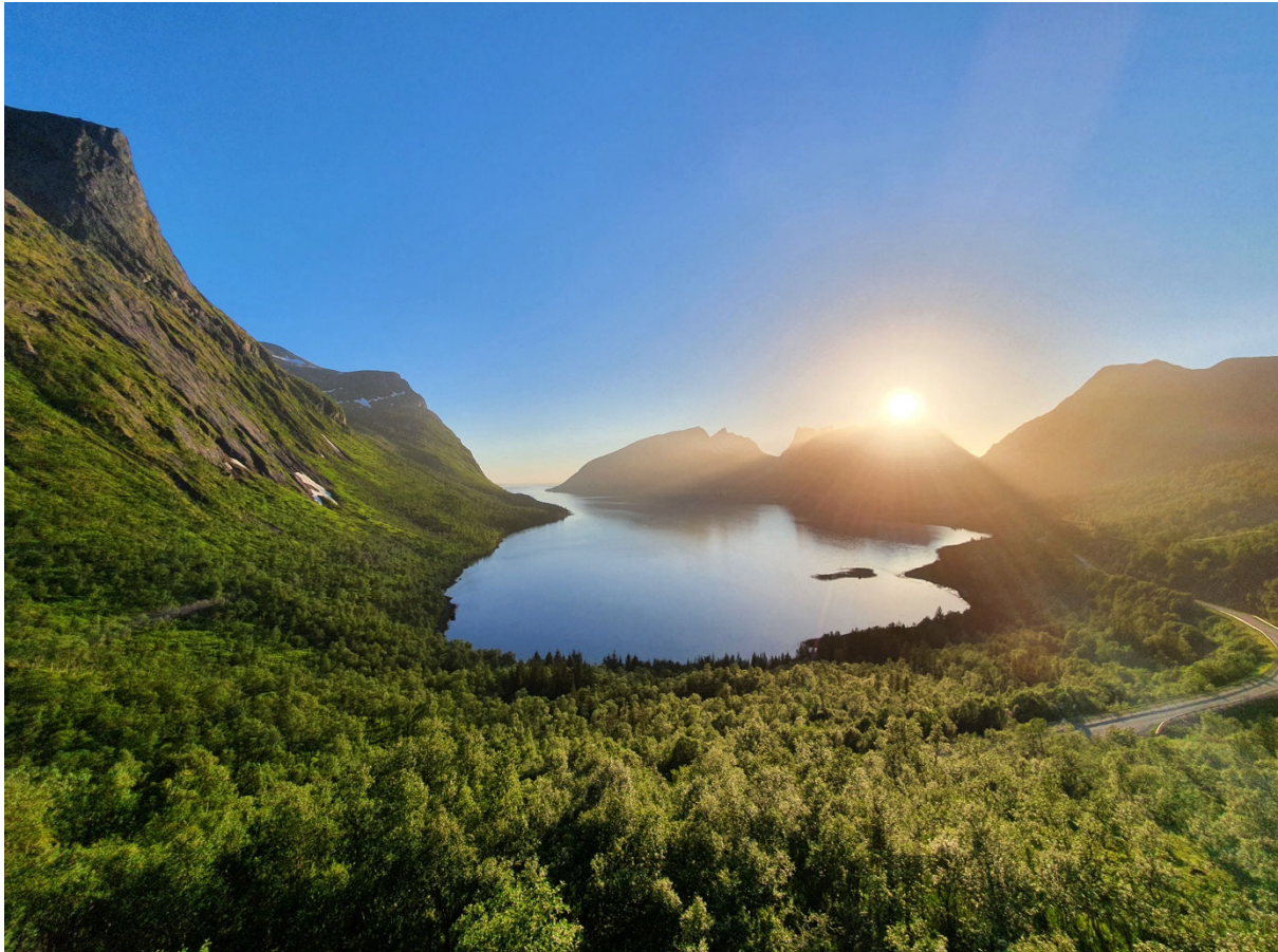
Skaland/Bergsbotn, fra Bergsfjordveien, Senja, 2021-07-02

Naturvernforbundet i Troms har i flere år hatt et høgt aktivitetsnivå med et bredt engasjement. For å kunne verne om naturarven, arbeide mot naturskadelige inngrep og fremme bærekraftig bruk av naturen har fylkestyret i disse årene etter beste evne fordelt ansvar og oppgaver. Dette for å kunne dra nytte av de forskjellige kvalitetene som til enhver tid er å finne i et styre, samt for å unngå slitasje på de tillitsvalgte. Det er vel kjent at selv om arbeidet med å verne om naturen gir mening og mye glede kan det også til tider være et krevende engasjement.