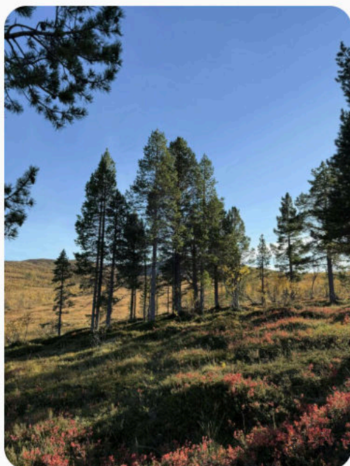
Furu – Pinus sylvestris Nordsamisk / Davvisámegiella beahci

Les uttalelsen 2025 har styrket vernet av Finnheia og Lille Blåmann publisert 13. desember – bl.a. underskrevet av Naturvernforbundet i Troms og lokallaget Tromsø og omegn.