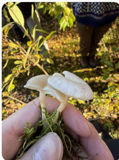
sannsynligvis er det hvit anistraktsopp – Clitocybe fragrans