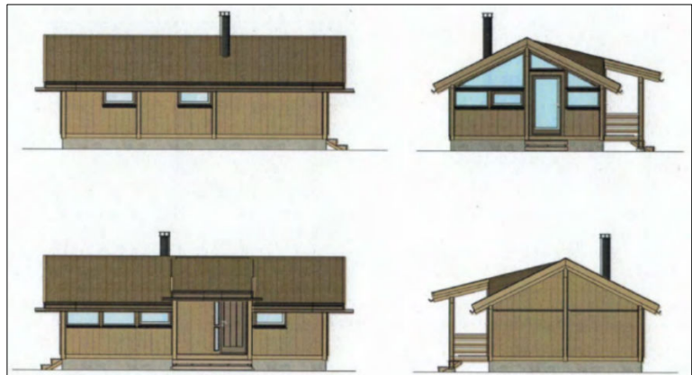
Tegninger av omsøkt ny hytte.