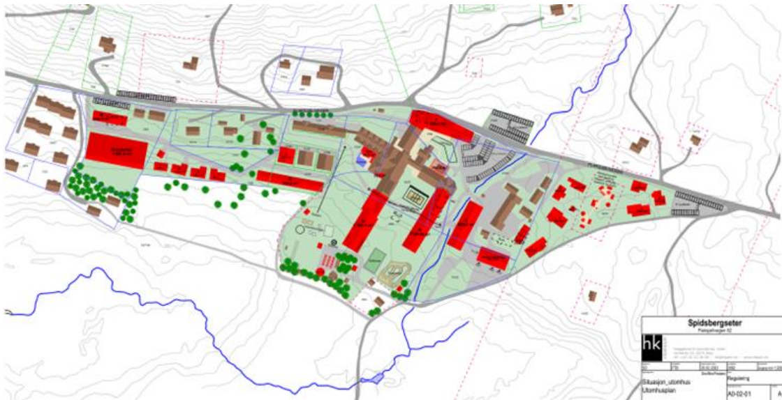
Figur 2: Brune bygg er eksisterende bygg, rødt er planlagte nybygg i detaljreguleringsplanen. Eksisterende hotellkompleks er brunt bygg midt i kartet. Sør for dette er det planlagt to nye hotellfløyer i rødt. Brune bygg vest for hotellet er solgt til private og drives etter prinsippet «sale and leaseback».

aktivitetstilbud, med innendørs ridehall, Spa-anlegg, aktivitetsbygg (mulig innhold bowling, kino og lignende aktiviteter) og uteområde (muligheter for lavvo, akebakke, bål/grillplass og servering).