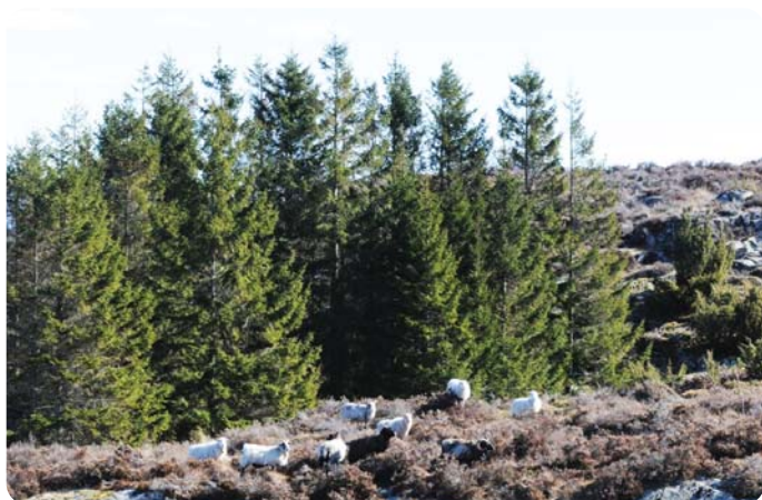
Granplantingene utkonkurrerer lyngheiene og dermed beitegrunnet for villsauen.