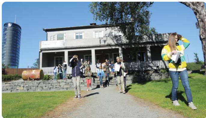
Mostun natursenter formidler naturkunnskap til barn og unge.

Arrangementer og aktiviteter blir fortløpende publisert på www.mostun.no og på facebookgruppen "Mostun natursenter".