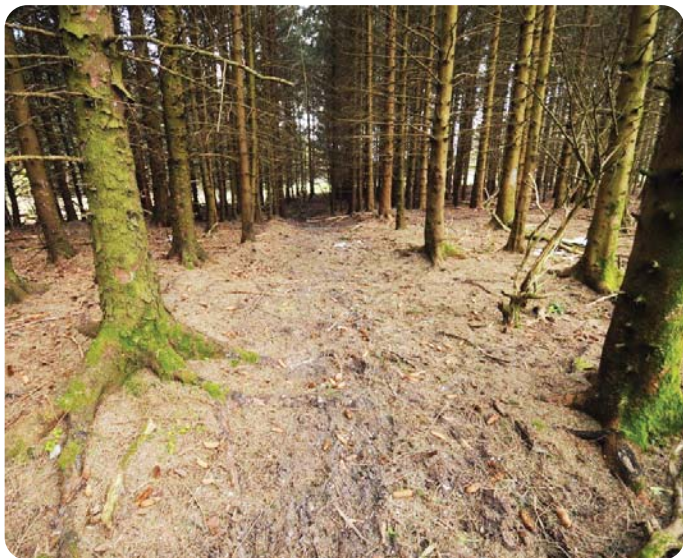
Brunt og dødt på bakken i sitkagranskogen.