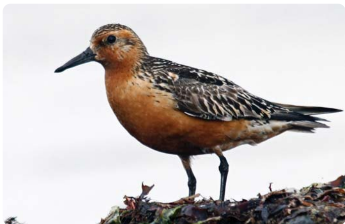
Polarsnippe, en arktisk gjest på Jærstrendene.