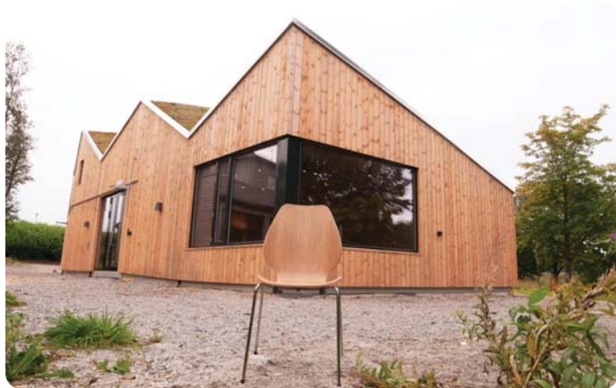
Inge Steenslands Hus og den norskproduserte City-stolen.

Byggingen av Inge Steenslands Hus på Mostun er et stort økonomisk løft for Naturvernforbundet. Vi trenger all den hjelpen vi kan få fra alle som støtter arbeidet vårt på Mostun natursenter. Det kan du gjøre ved å gi Mostun en stol! Stolen koster kr 1500,- og du vil som takk få navnet ditt på stolens rygg. Innbetaling kan du gjøre til vår gavekonto 3201 41 63327. Hjertelig takk for støtten!