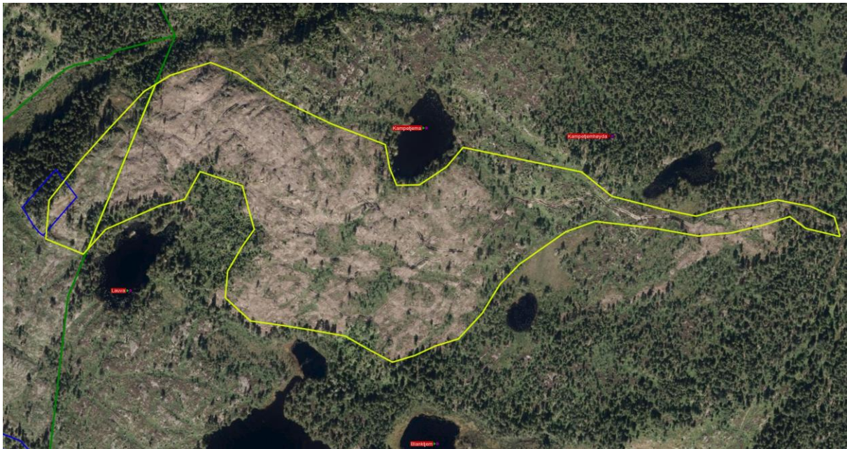
Figur 1. Nøkkelbiotopen ligger nord i Lauvlunddalen i Halden kommune, helt på grensa til Aremark. Skadet nøkkelbiotop er vist med blå linje til venstre i bildet. Grønn linje er kommunegrensen mellom Halden, Aremark og Rakkestad.

Hogstfeltet som omfattes av denne klagen ligger på gnr/bnr 136/2 i Halden kommune og omfatter et areal på ca. 12 daa. Hogstfeltet er en del av et større område (150 daa) som ligger i Aremark kommune.