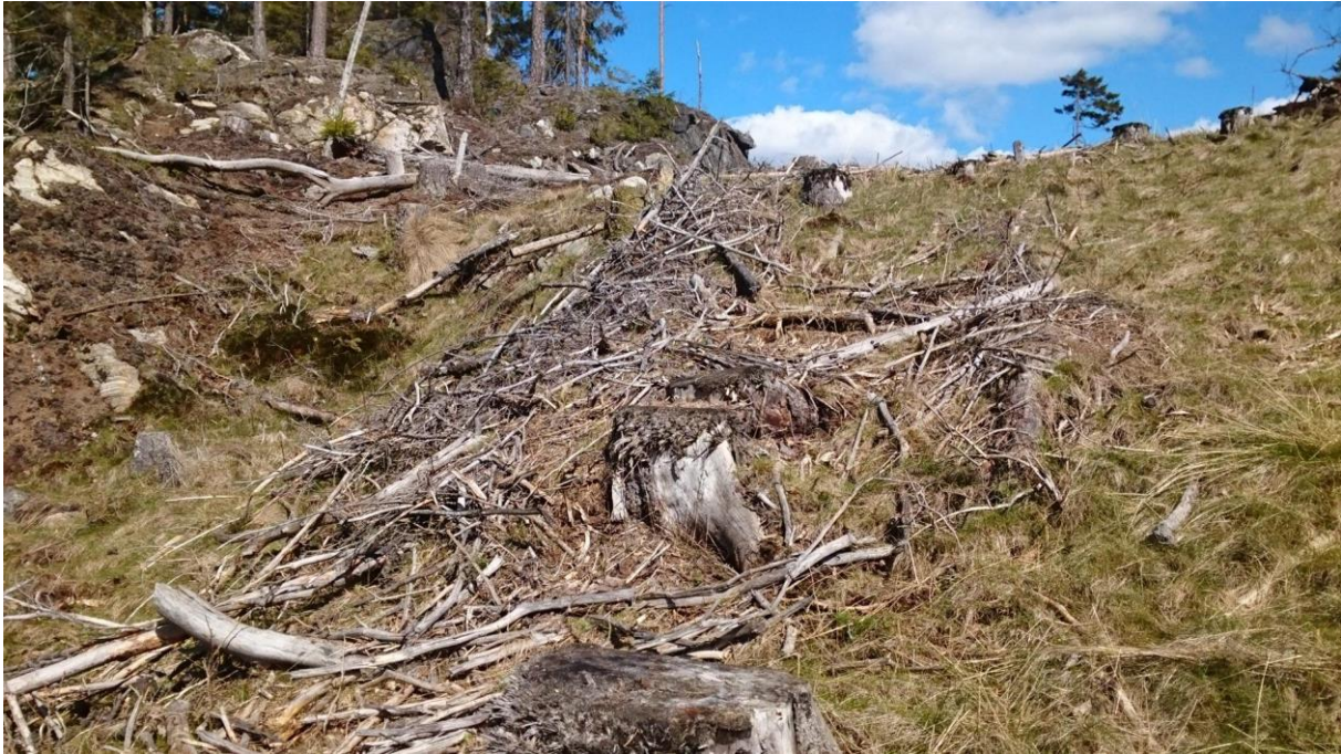
Figur 3. Den skadede delen av nøkkelbiotopen er helt snauhogd.

Naturvernforbundet vurderer dette som et avvik fra standarden og anmoder kommunen om å se nærmere på saken og informere grunneier om denne klagen.