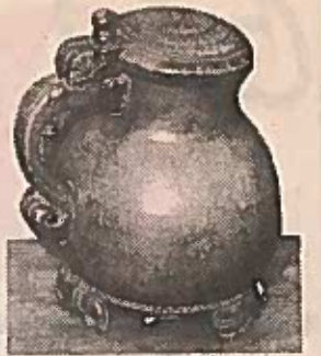
En fin vase var en av de mange antikviteter som var til salgs under kunst- og antikvitetsmessen i Njårdhallen.