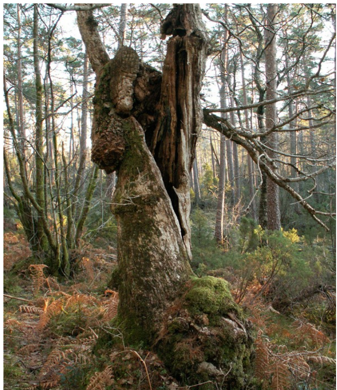
Bilde 2 Gammel eik

NNV vil ikke gå inn på vurderinger av veialternativer, da hele inngrepet er uakseptabelt. Det er god grunn til å frykte at en etablering av industriområde på Neshalvøya kombinert med de store kostnadene knyttet til bygging av veien vil presse frem en videre utbygging i området. Dette vil blant annet true Nestunet og den viktige lokaliteten med gamle eiketrær nord for tiltaksområdet (bilde 2).