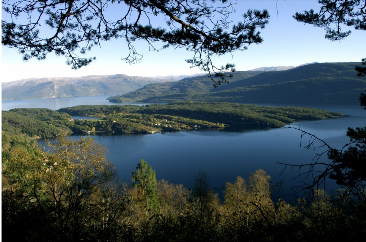
Bilde 1: Neshalvøya sett fra vest

Landskapet på Neshalvøya er spesielt verdifullt fordi området viktige lokale og regionale verdier er omkranset av nasjonalt og internasjonalt verdifulle landskapstyper, som vestlandsbygdene, fjorden og fjellene. Neshalvøya har stor variasjon i vegetasjonstyper.