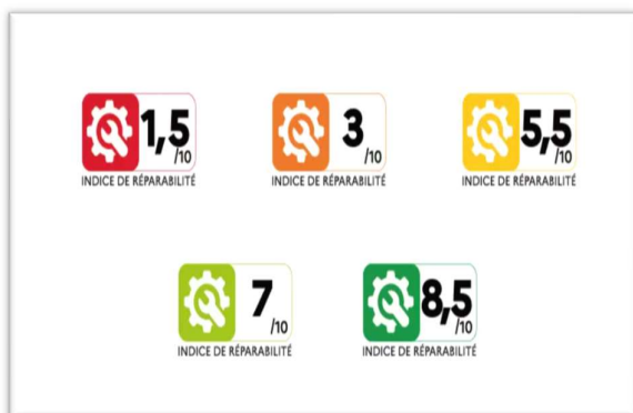
I Frankrike må telefoner merkes med hvor enkelt det er å få dem reparert.