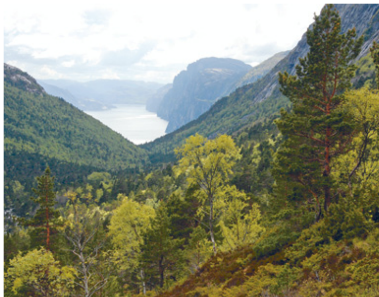
Fra Skurvedalen, Lysefjorden i bakgrunnen.