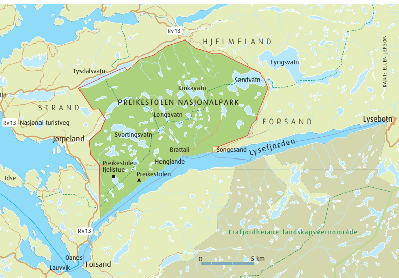
Preikestolen nasjonalpark – Naturvernforbundets forslag. Kart: Ellen Jepsen.

Politikere, organisasjoner og næringsliv i Rogaland må stille seg samlet bak et krav om nasjonalpark i Preikestolområdet. Uten bred lokal støtte er det lite sannsynlig at regjeringen vil gi grønt lys for å utrede Preikestolen nasjonalpark. Først når det blir satt i gang en utredning vil omfang og grenser for nasjonalparken bli avklart. Denne avklaringen vil da skje i samråd med lokale interesser og berørte parter. Det er storting og regjering som oppretter nasjonalparker i Norge.