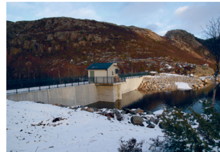
Svortingsvatn er et av flere regulerte vann og vassdrag vest i området.

Turister søker til nasjonalparker. Følgelig vil Preikestolen nasjonalpark få en enda sterkere tiltrekningskraft og gi grunnlag for betydelig lokal verdiskapning basert på bærekraftig turisme. Nasjonalpark vil bevare naturverdiene og skape nye verdier for lokalsamfunnene.