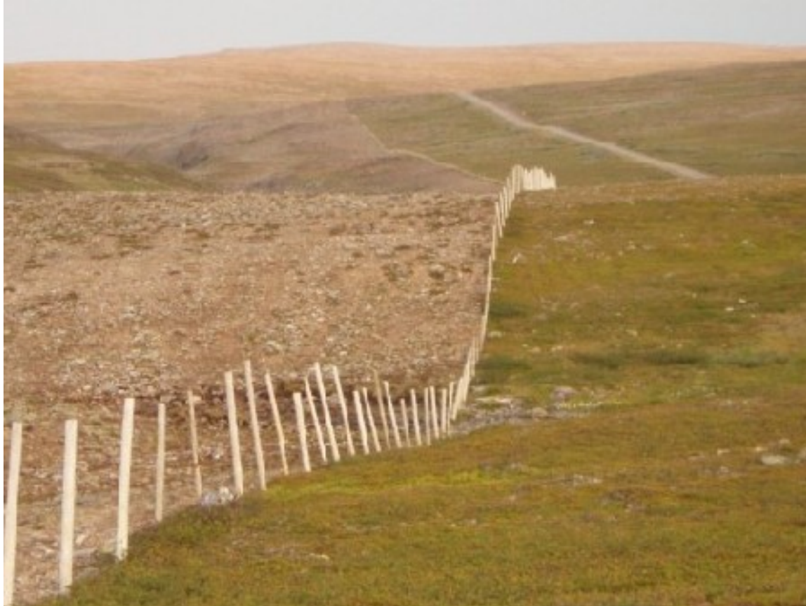
Ifjordfjellet slakte og merkeanlegg