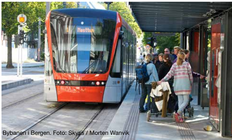
Bybanen i Bergen.

kollektivt. Kjøprising gir også mindre helseskadelig forurensing, noe som gir lavere kostnader for helsevesenet og store fordeler for astmatikere og andre som lider under dårlig luft.