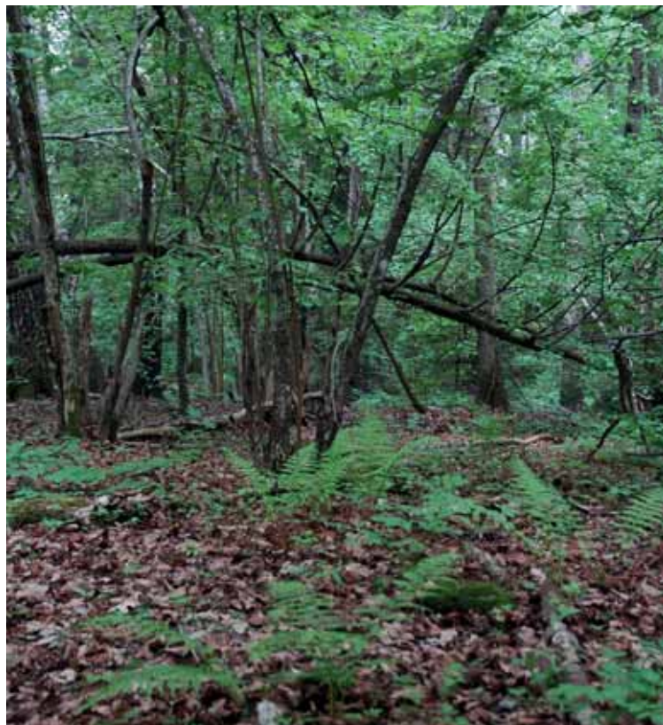
Løvsog i Bålerudlia.