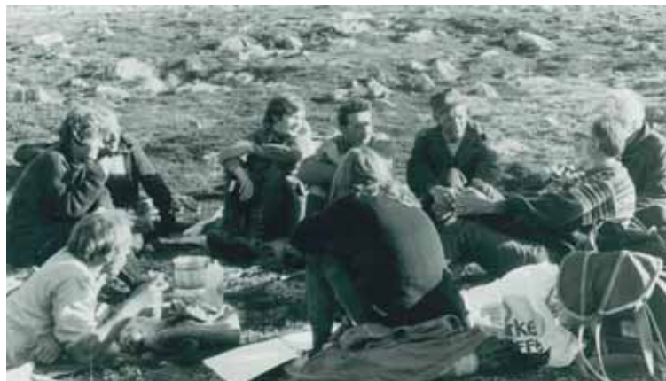
Ikke-volds- og økoseminar i Sandgrovbotten, august 1970.

Det er avklarende fordi det kan få oss til tenke grundigere igjen om hva som fortjener betegnelsen «god mening», og hva «livet» og «menneskelighet» egentlig er. Vi synes også det er fruktbart å snakke om «det menneskeverdige». Det menneske-