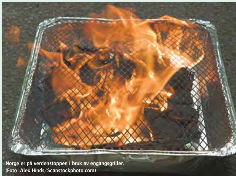
Norge er på verdenstoppen i bruk av engangsgriller.

Regjeringen gir 100 millioner kroner ekstra til kollektivtrafikk. Pengene skal kompensere for den økte oljeprisen, og sikre at ikke prisene på buss og båt øker tilsvarende.