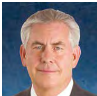
Rex Tillerson.

Oljeselskapet Exxon Mobil har bestemt seg for å gi mindre penger til organisasjoner som er skeptiske til klimaendringer.