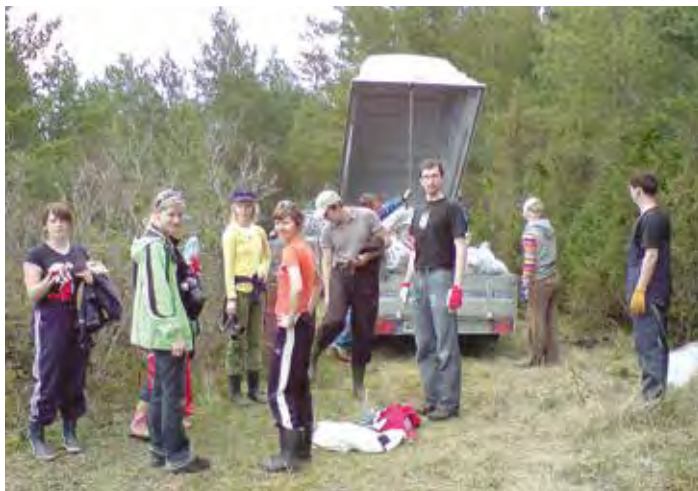
Her er en håndfull av de 50 000 som var med på å gjøre Estland rent.

I mai ryddet 50 000 frivillige hele Estland for søppel. Litauen ville ikke være dårligere, og arrangerte en ryddeaksjon samme dag.