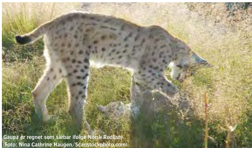
Gaupa er regnet som sårbar ifølge Norsk Rødliste.

Artsdatabanken — Tenk langsiktig! Styrk biologi som fag i hele utdanningskjeden. Dette er avgjørende for at biologisk mangfold i fremtiden skal