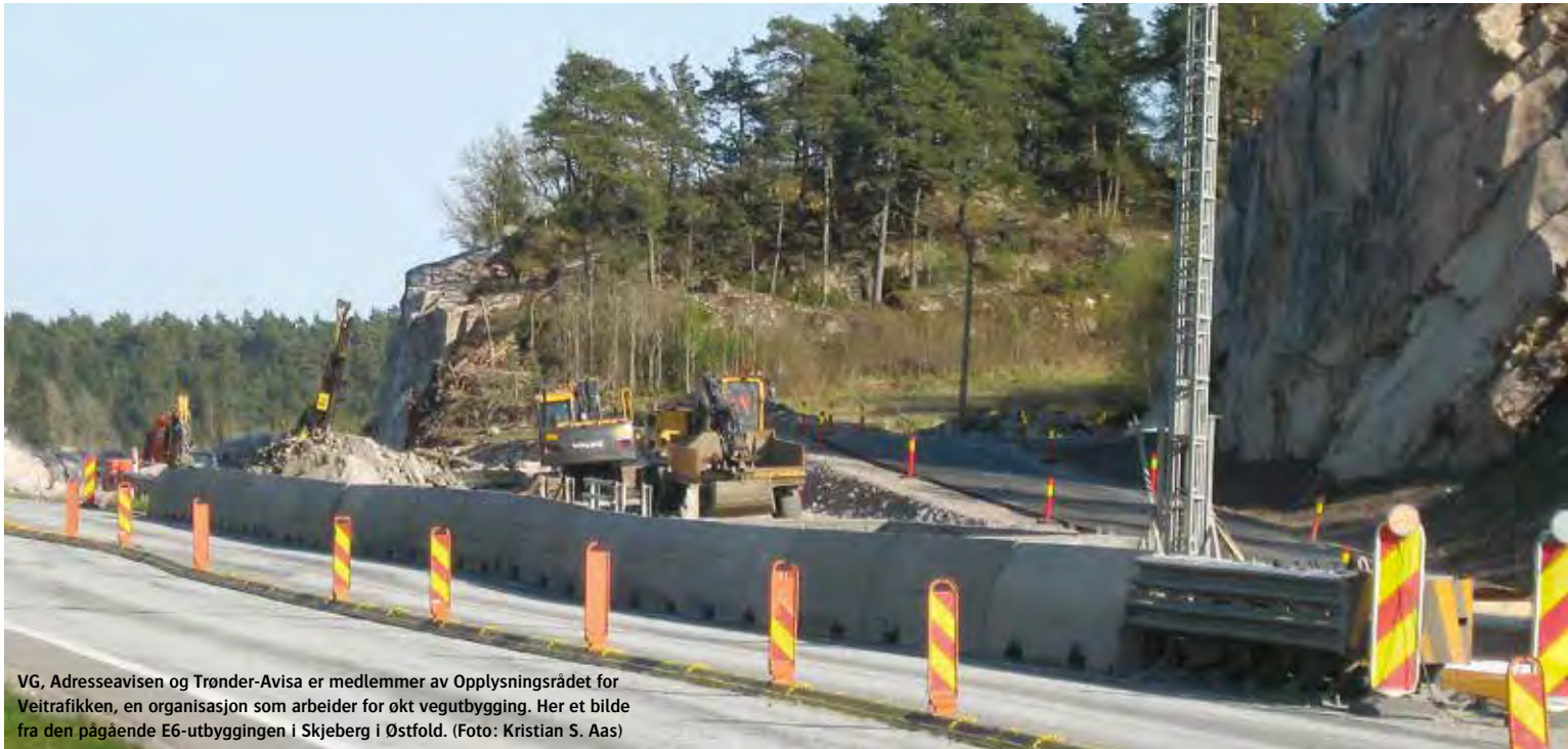
VG, Adresseavisen og Trønder-Avisa er medlemmer av Opplysningsrådet for Veitrafikken, en organisasjon som arbeider for økt vegutbygging. Her et bilde fra den pågående E6-utbyggingen i Skjeberg i Østfold.

er med er svært skadelig for deres miljøtroverdighet på samferdselsiden, sier Liebe.