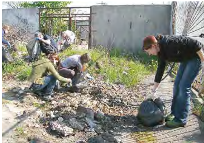
Litauen ville ikke være dårligere, og organiserte en kampanje på rekordtid. Den omfattet 14 byer.