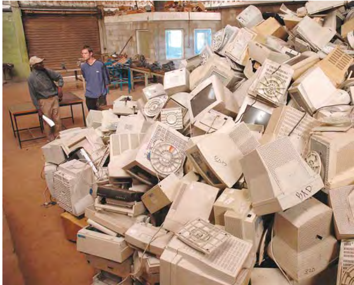
935 norske pc-skjermer som har vært brukt i Kenya, sendes nå tilbake til Norge for avfallsbehandling.

Eksport av datautstyr utgjør et betydelig problem for land i Afrika og Asia. Mye skipes ulovlig fra rike land i vesten, fordi det er billigere enn å levere utstyret til avfallsbehandling hjemme. I utviklingslandene har det elektroniske avfallet nå blitt en trussel mot miljø og helse. Elektronisk utstyr består av en rekke miljøgifter. Pc-skjermene som nå er på vei tilbake til Norge inneholder tungmetaller, bromerte flammehemmere, klorforbindelser og giftige gasser. Hver skjerm har mellom 1,8 og 3,6 kilo bly i seg. Det betyr at hele partiet inneholder cirka 3 tonn bly.