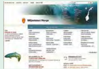
Miljøstatus i ny drakt. (Faksimile)

Tyrkia ratifiserer Kyoto-avtalen. Regjeringen foreslår en tilslutning, og har flertall i parlamentet.