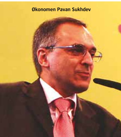
Økonomen Pavan Sukhdev

På Madagaskar vil beskyttelse og forvaltning av landets biologiske mangfold bare koste halvparten av de verdiene det vil gi. Og det er ikke lite. En studie fra Maosola nasjonalpark viser at skogens