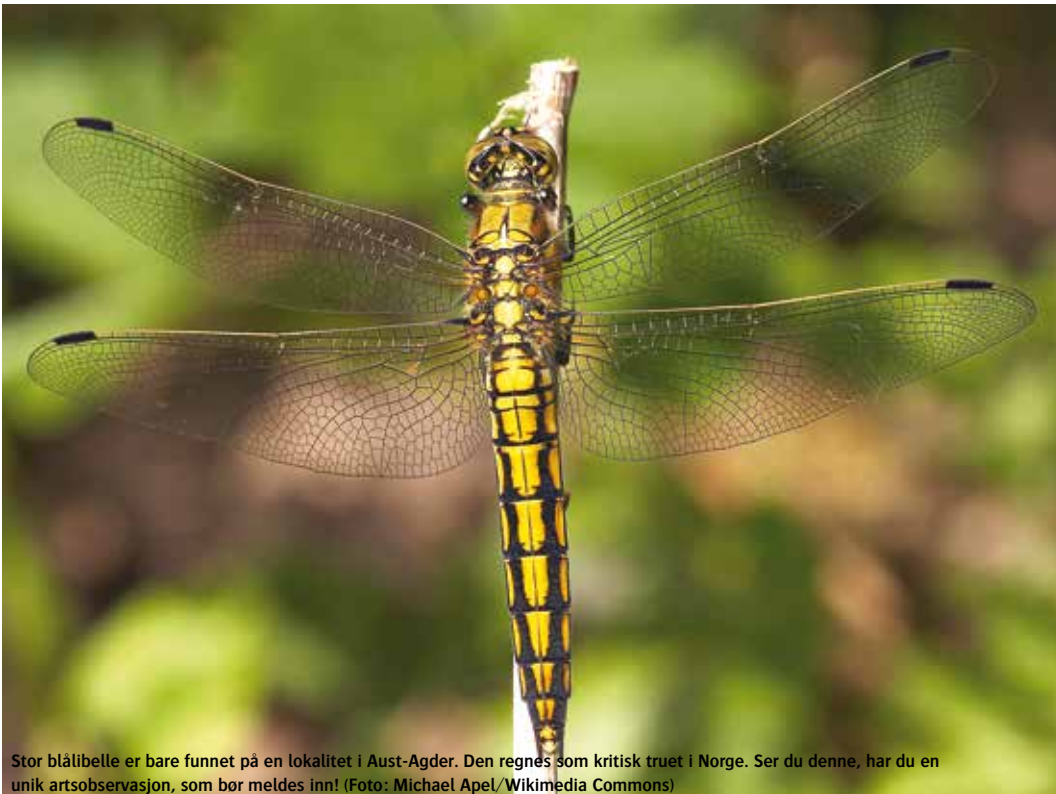
Stor blålibelle er bare funnet på en lokalitet i Aust-Agder. Den regnes som kritisk truet i Norge. Ser du denne, har du en unik artsobservasjon, som bør meldes inn!

Nå kan alle melde inn observasjoner de gjør til et nytt nettsted åpnet av Artsdatabanken som heter artsobservasjoner.no.