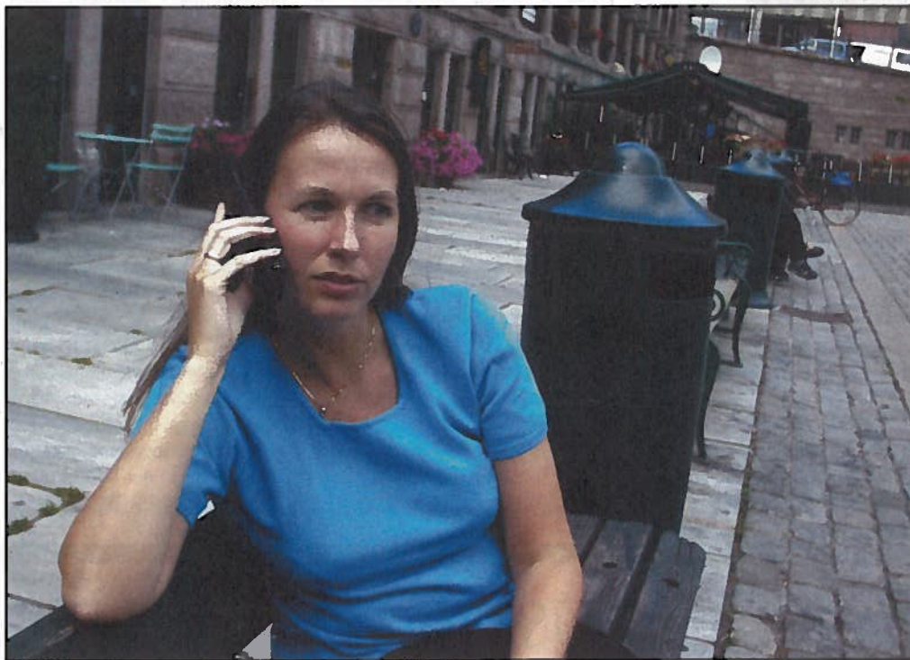
Norge har 2,7 millioner mobilabonnenter. De har kjøpt 5,7 millioner telefoner.

Når året er omme har vi nordmenn kjøpt om lag halvannen million mobiltelefoner. Siden 1994 har vi skaffet oss nesten seks millioner apparater. Returandelen er under en halv prosent.