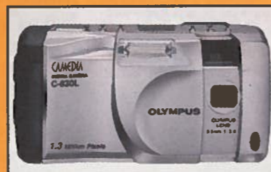
Vinneren blir offentliggjort i N&M Bulletin 1/2001.

Alle som betaler abonnement innen fristen deltar i trekningen av et Olympus Camedia C-830L digitalt kamera med innebygd blitz. Bildeoppløsningen kan varieres. På lav oppløsning er det plass til mer enn 60 bilder. Veiledende utsalgspris: 3990,- kroner.