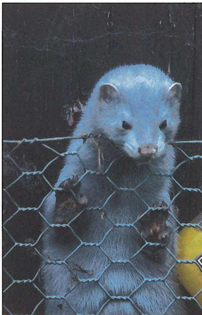
Rømt mink bukker ofte under i naturen, men de som klarer seg utgjør en stor trussel mot fuglelivet.

Dyrevernere slapp nylig ut 1500 mink på Eidsvoll. I tillegg rømmer trolig et stort antall dyr årlig fra norske pelsfarmer. Forskerne vet at minken gjør store innhogg i fuglebestandene, men ikke hvor store, ettersom myndighetene ikke er interessert i å finne det ut.