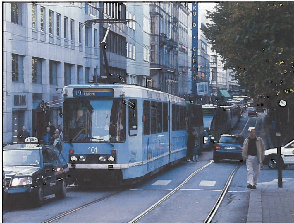
Budsjettforliket mellom Arbeiderpartiet og sentrumspartiene betyr mer penger til kollektivtrafikken i Oslo.